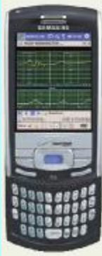
SmartPhone & Pocket PC February, March 2006

Alaris® UB allows doctors to see vital information about a baby in the womb, and about a mother as she gives birth.